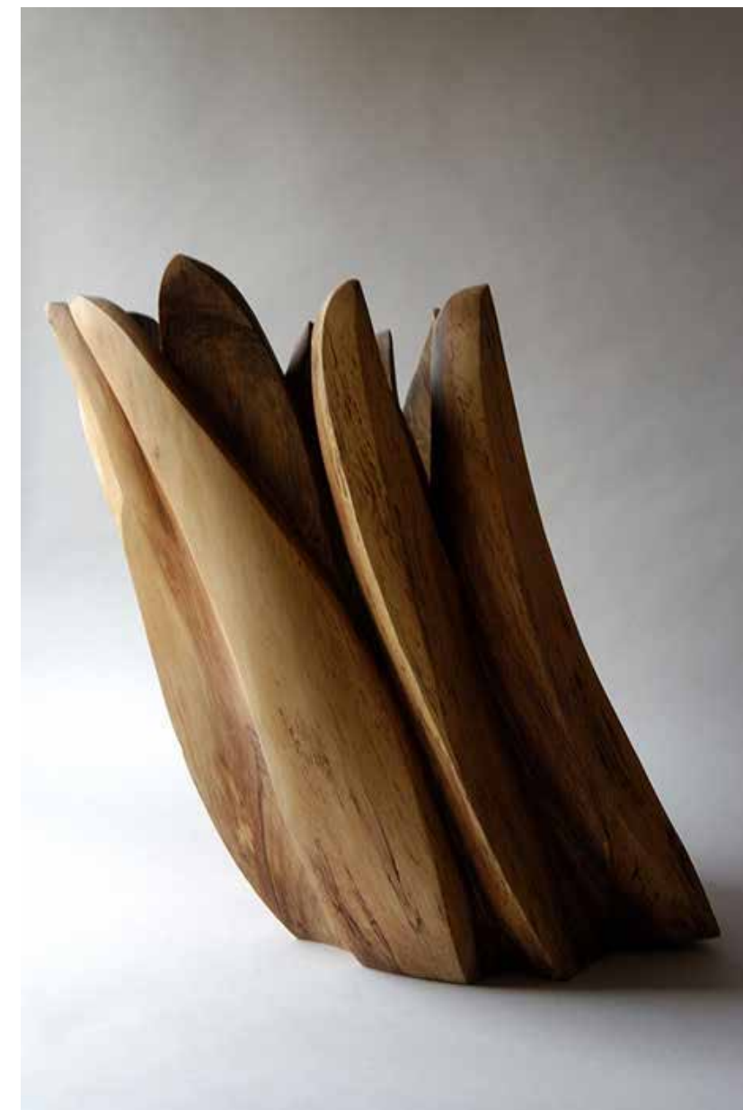
VENT du NORD (seria Trawy) Materiał: brąz numerowany Wymiary: 15/33/11 cm Certyfikat: Certyfikat Autentyczności Limited Edition Rok: 2013